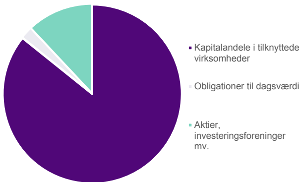
Forenet Kredit f.m.b.a. Sammensætning af aktiver (%)

Forenet Kredits væsentligste aktiv er aktierne i Nykredit A/S, som udgør samlet 63.538 mio. kr. Dertil kommer de øvrige investeringer på 10.542 mio. kr. som vist i figuren nedenfor.